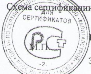
Схема сертификации: 7.

ДОПОЛНИТЕЛЬНАЯ ИНФОРМАЦИЯ Место нанесения знака соответствия: знак соответствия по ГОСТ Р 50460-92 наносится на корпус изделия и (или) в эксплуатационную документацию.